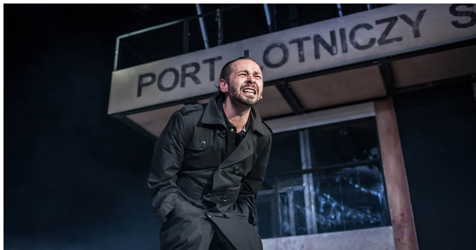
fol. Bartłomiej Sowa

Korzystając w ostatnich latach z usług kolei, trudnooprzeć się wrażeniu, że bierze się udział w thrillerze korporacyjno-dworcowym z elementami czarnego humoru.